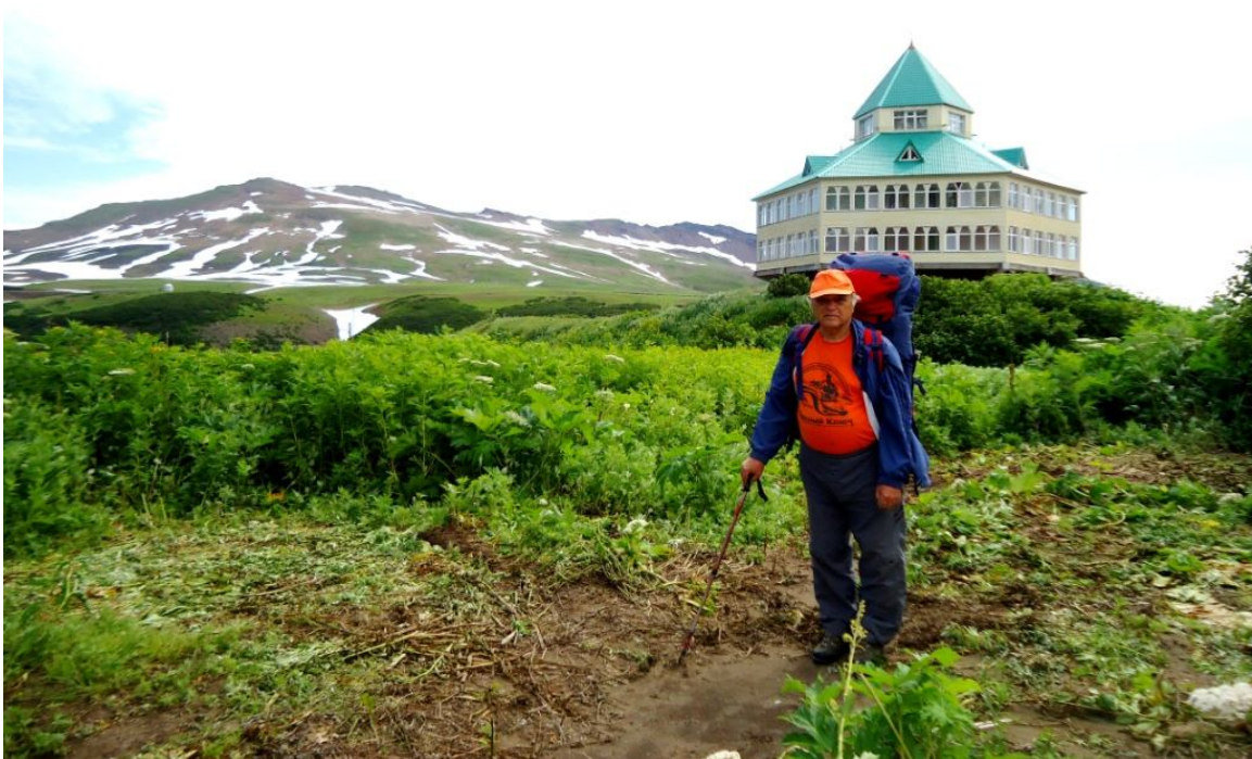
Гостиница Мутновской ГеоТЭС

При въезде на ГеоТЭС установлен шлагбаум и стоит охрана: пересекать территорию станции нельзя, режимный объект. Но нормальные герои всегда идут в обход. Вот и мы обошли станцию по периметру и вышли в жилую зону. Поразило: часть домов в руинах – следы землетрясения. На их фоне роскошно смотрится здание гостиницы, где расположилось общежитие и небольшая столовая. Отсюда хороший обзор всей ГеоТЭС.