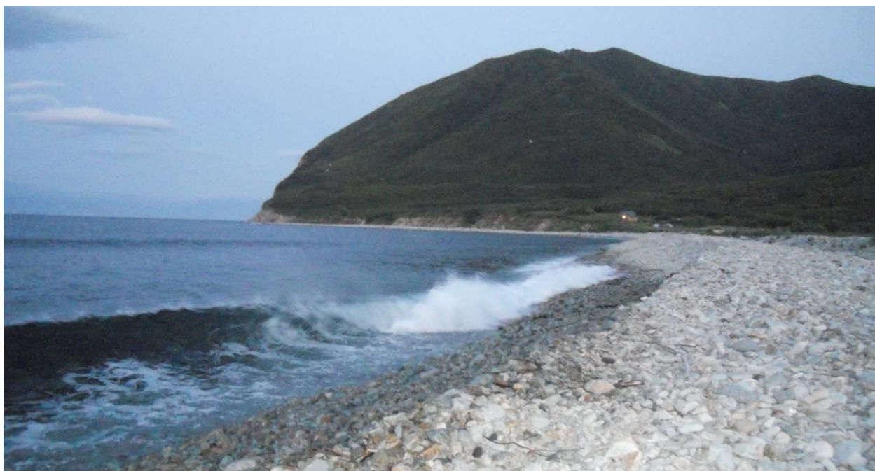
Тихий океан, бухта Большая Саранная

Океан нас кормил, приносил свои дары в виде крабов, морских ежей, ламинарий. Мы сами ловили рыбу, угощали нас и рыбаки крабами, рыбой, икрой.