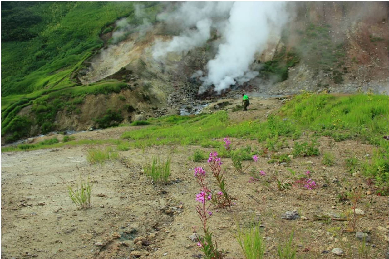
Малая долина гейзеров (Дачные источники)

Вблизи ГеоТЭС и одного из термальных источников мы и обустроили свой базовый лагерь. Напротив нашего лагеря у подножья сопки Скалистой, на поверхность выходят Дачные горячие источники. Данное место еще называют «Малой долиной гейзеров», которое представляет собой активное фумарольное поле (фумарола – место выхода вулканического газа), горячие газы которого проходят сквозь воду холодного ручья, нагревают его и, в ряде случаев, создают эффект фонтанирования. Здесь вы увидите маленькие гейзеры, небольшие резервуары с термальной водой, кипящие лужицы, цветные грязи.