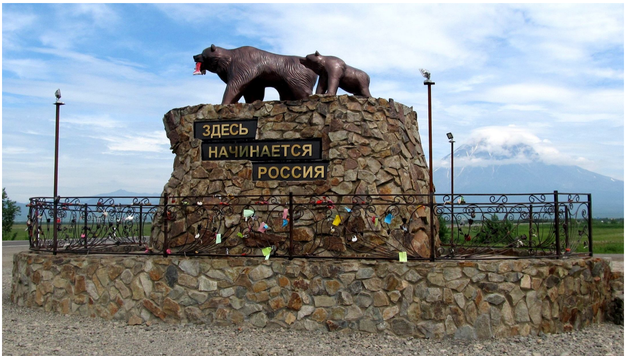
Стелла «Здесь начинается Россия»

Я опутана мыслями, куда смотреть, что запомнить, о чем думать, о чем мечтать. От того, что голова бесконечно крутится вокруг шеи, я, кажется, подустала, голос внутри меня стих, и очень хочется спать. Все перепуталось: уфимское время, перевод часов назад в московское, потом вперед на 8 часов - камчатское время. Сна нет, но усталость чувствуется. Внутри все стихло в ожидании встречи с Камчаткой.