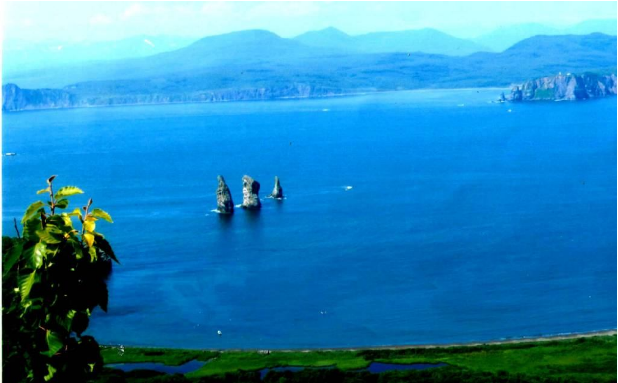
Авачинская бухта, Три брата

Далекая Камчатка! Ты стала ближе. Мы увезли с собой самые яркие впечатления и воспоминания. Многие из нас осуществили свою мечту. Мы тебя полюбили навсегда. Будем следить за твоим каждым вздохом, огненным дыханием.