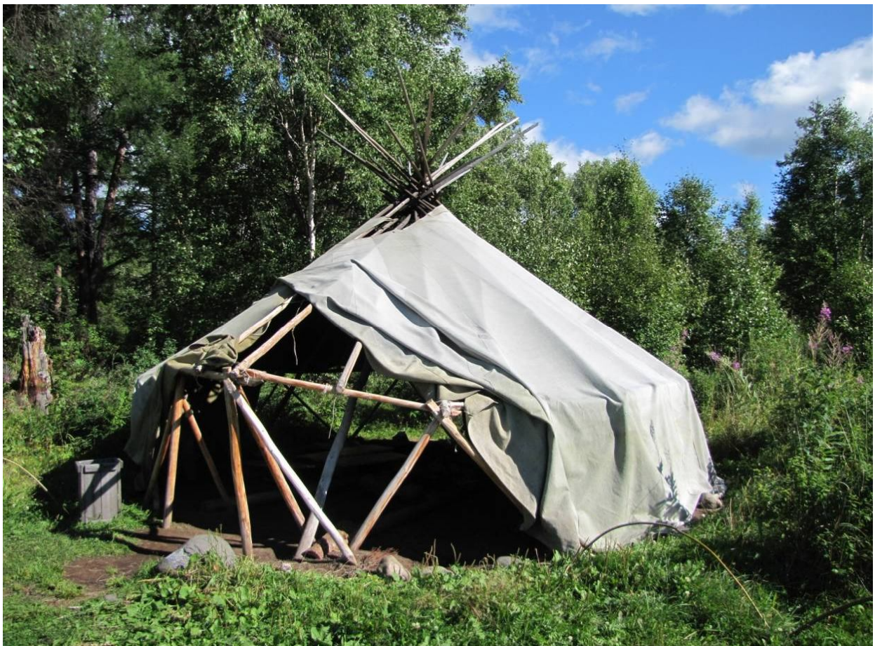
Этническое стойбище Чау-Чив в поселке Эссо