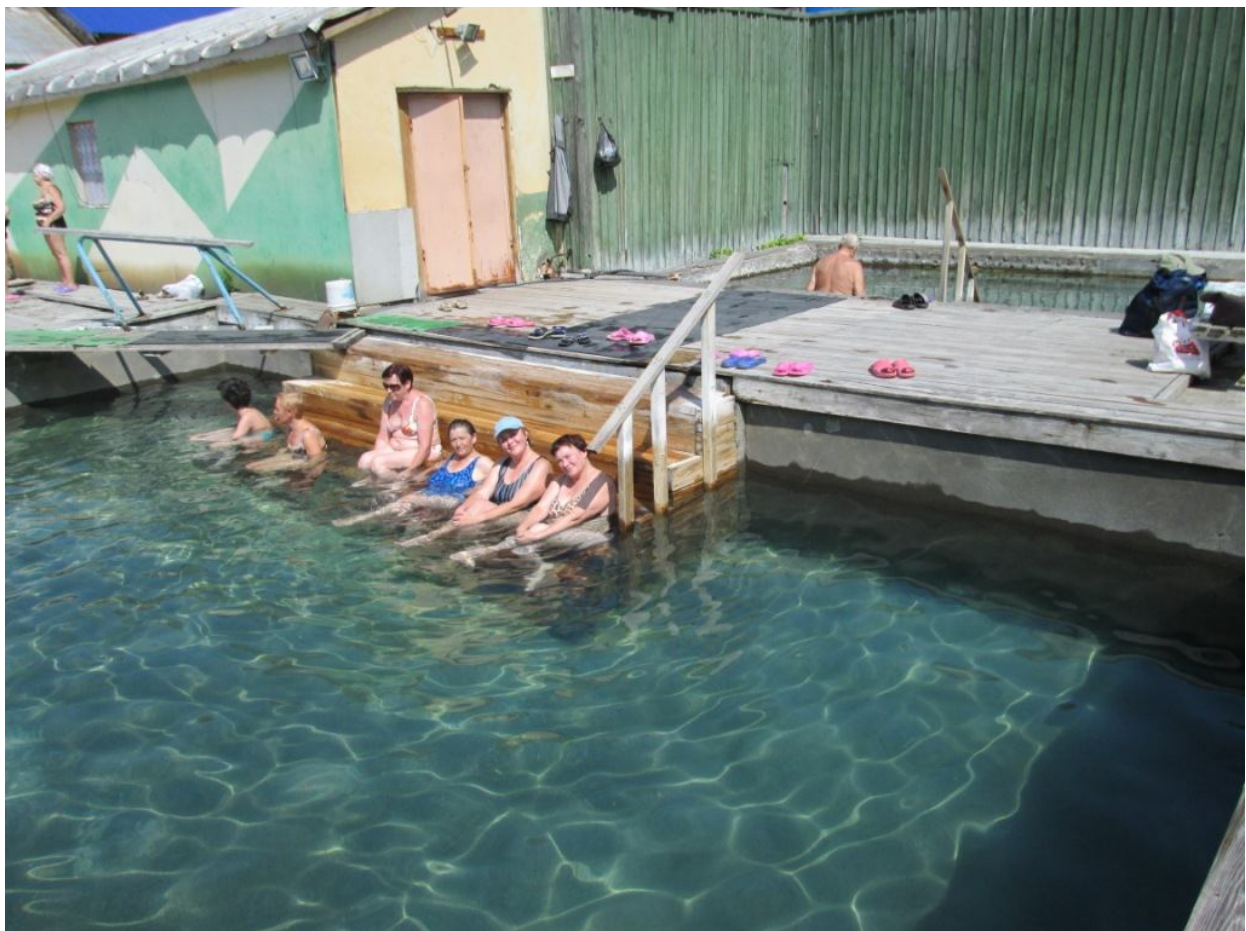
Один из Нижних Паратунских горячих источников - Медвежий угол