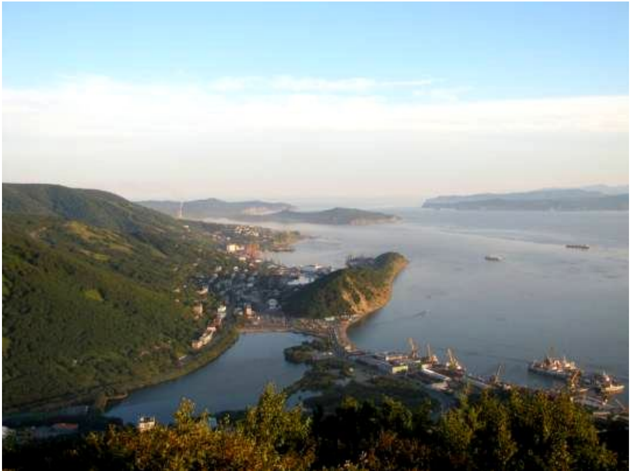
Панорама города Петропавловск-Камчатский с г.Мишенная сопка

Петропавловск-Камчатский. Город два дня был окутан туманом. Наконец-то он рассеялся. Сияют снежные вершины Вилучинского, Корякского, Авачинского вулканов, освобождаясь от тумана, они возвысились перед нашим взором, показывая свое величие. Знакомимся с городом, с людьми.