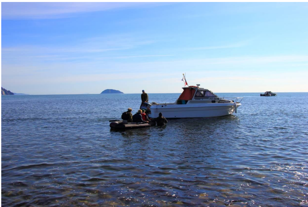
Высадка на берег

Свой лагерь мы разбили на берегу мелководного потока, вытекающего из Большого Саранного озера, у впадения его в океан. Местные рыбаки называют этот поток лиманом. Вода в нем солоноватая на вкус.