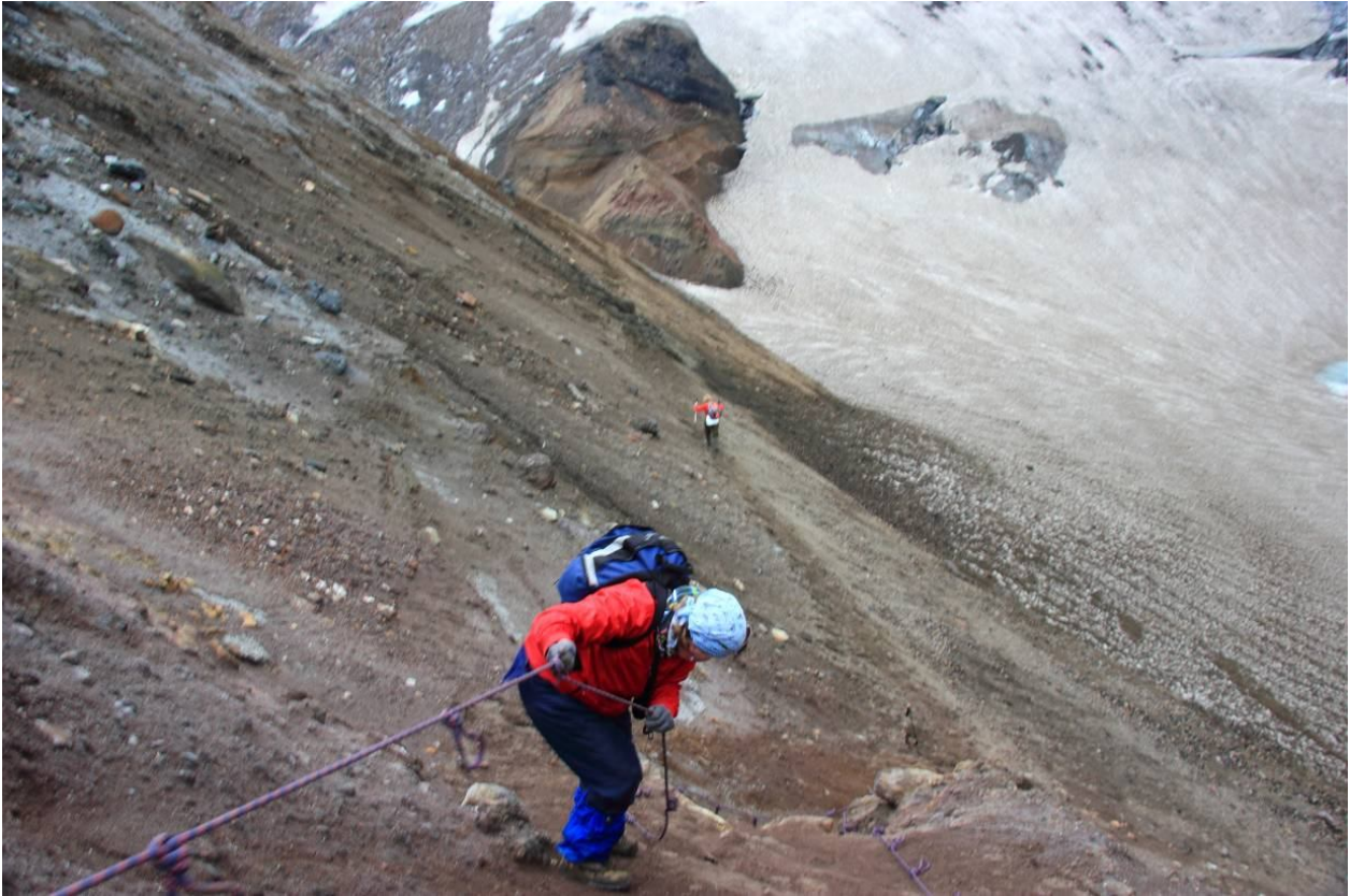
На склоне вулкана Мутновский, спуск с кратера.

Обратный путь пришлось пройти в тумане, в полной темноте с фонарями. В лагерь мы пришли глубокой ночью. Все хорошо, что хорошо кончается.