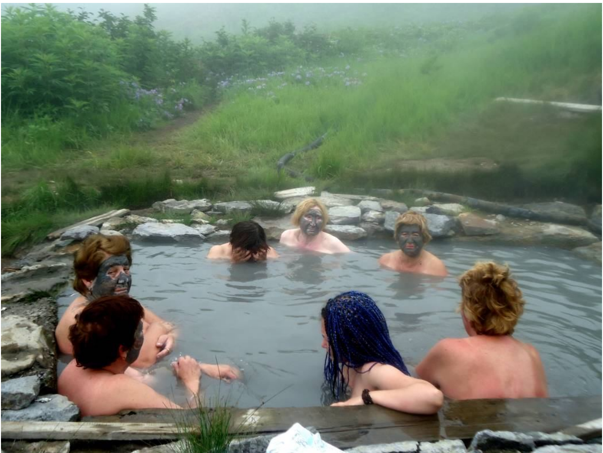
«Народный» курорт вблизи Мутновской ГеоТЭС

В термальной воде обнаружены термофильные водоросли, по склонам есть выходы голубой глины.