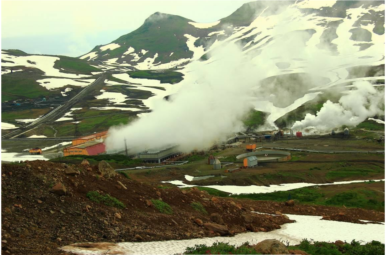
Мутновская геотермальная электростанция

В термальной воде обнаружены термофильные водоросли, по склонам есть выходы голубой глины.