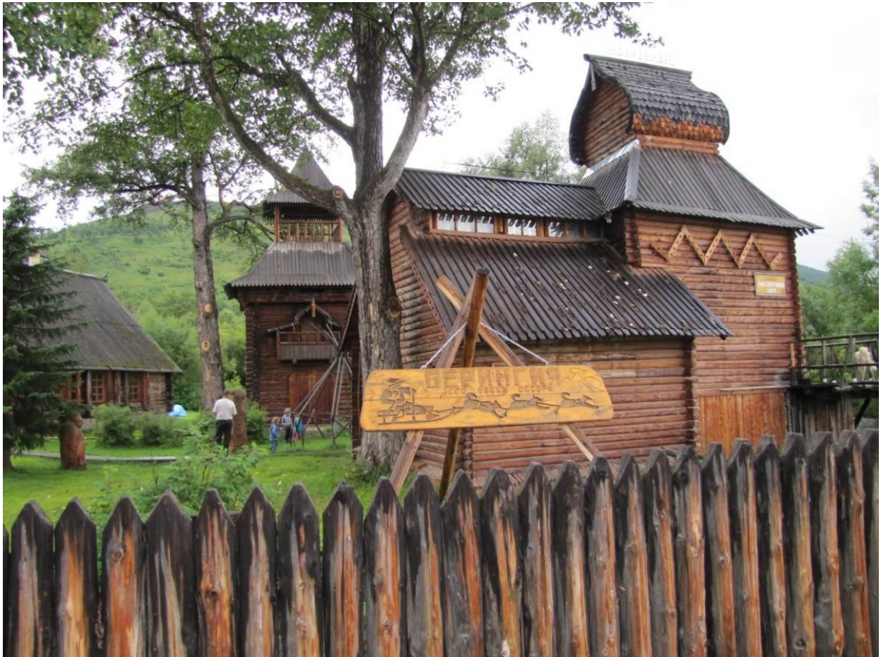
Этнографический музей в поселке Эссо