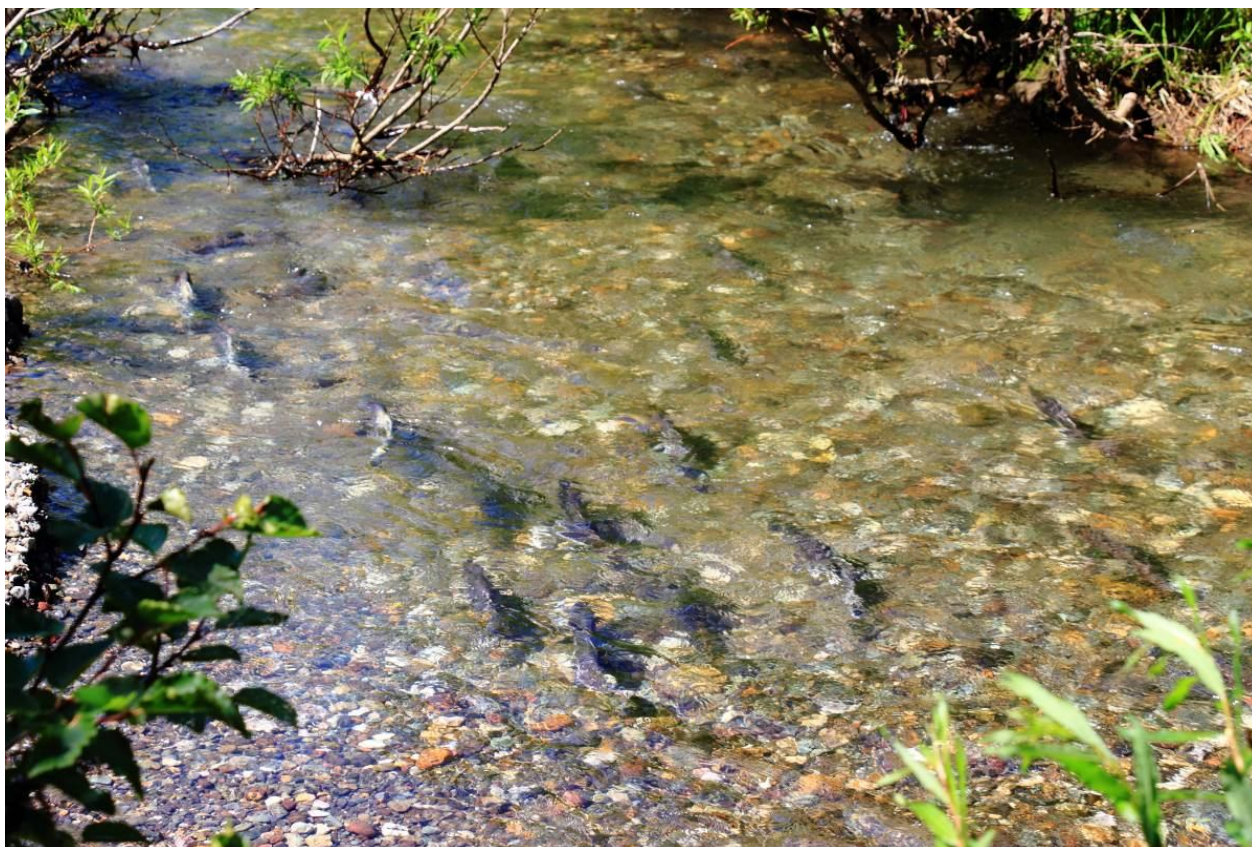
Рыба идет на нерест

Самым ярким впечатлением было от рыб, идущих на нерест. Многочисленные рыбы «полки» сплошным потоком, впритык друг к другу двигаются вперед и только вперед. Миграция на нерест рыбного потока наводит на самые разные мысли. Это стоит видеть, хотя бы раз в жизни. Каким же инстинктом, ответственностью наделила природа этих живых существ нашей планеты. Это же уму не постижимо - так торопиться на смерть, чтобы дать потомство! Попытка понять, сравнить их с остальными живыми существами нашей голубой планеты, вызывает слезы, необыкновенную благодарность «Создателю», и бесконечную гордость за тех, кто продолжает род.