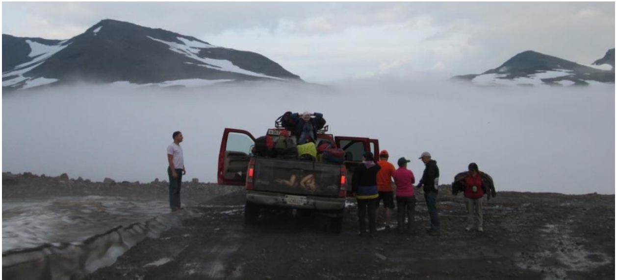
К начальной точке маршрута

В Термальном нас ожидал арендованный внедорожник, который и доставил нас на ГеоТЭС.