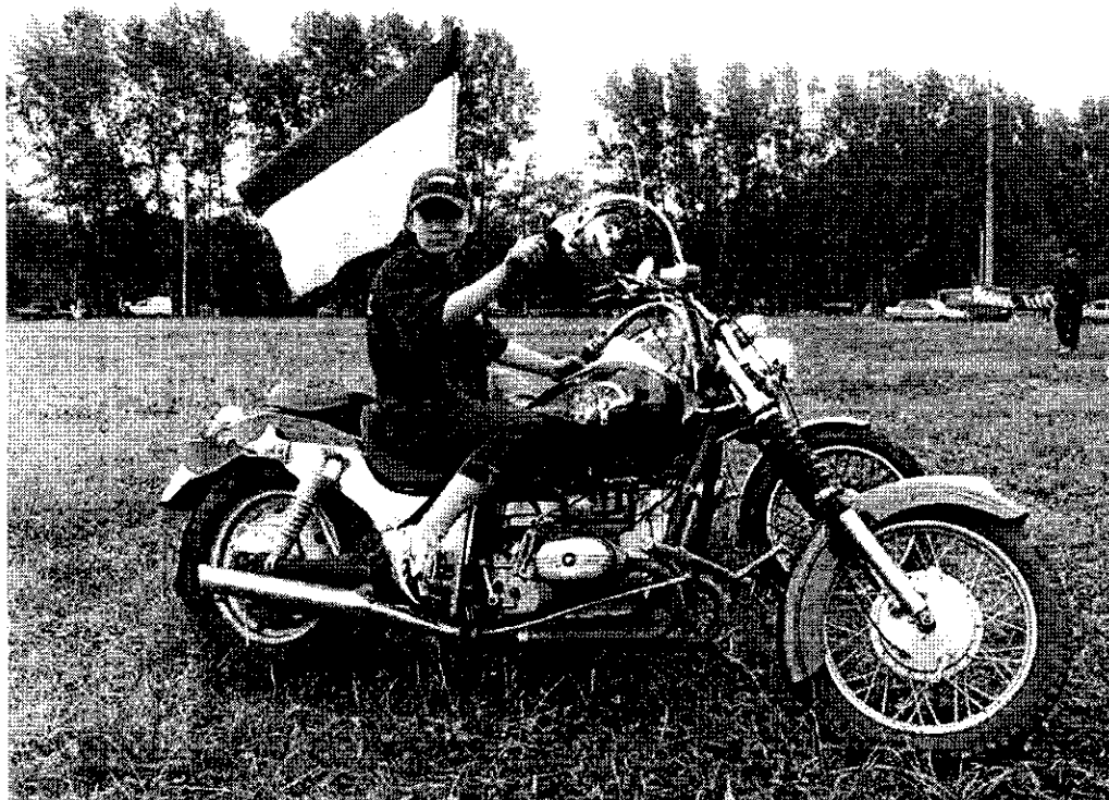
20-22 июня 2003 г. в районе Нугушского водохранилища Мелеузовского района Башкортостана прошел 4-й открытый региональный слёт мотоциклистов "Мы и мотоцикл-2003" .